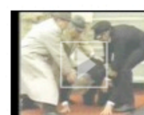
Tine Norwegian Dairy: Tine Milk